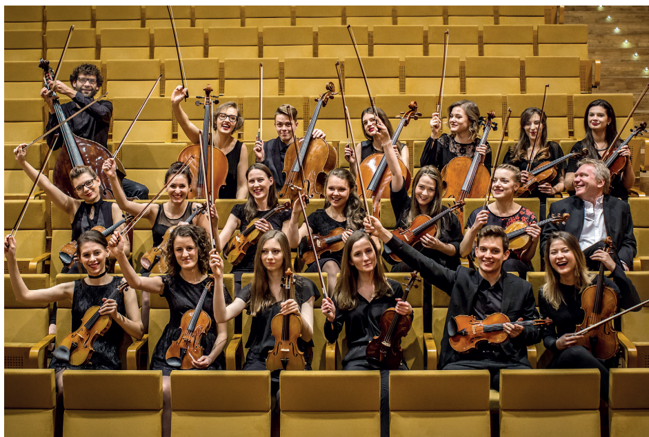
Orkiestra Smyczkowa PRIMUZ