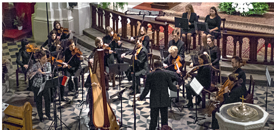
Orkiestra kameralna ARTE POSITIVA